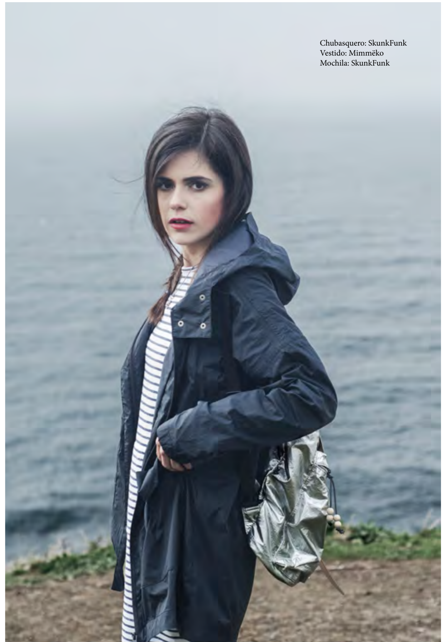
Chubasquero: SkunkFunk Vestido: Mimmëko Mochila: SkunkFunk